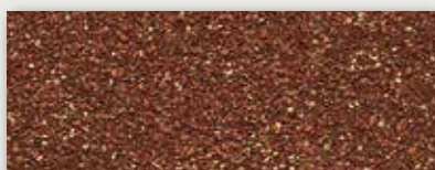
48 Brique orangé - Brick orange