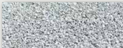
Blanc dépolluant NOx-Activ Depolluting NOx-Activ white