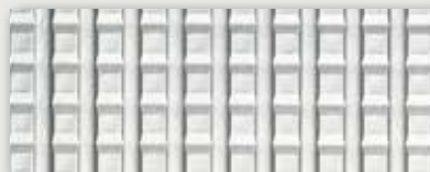
Gris zinc - Light zinc grey