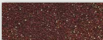
45 Brique rouge - Brick red