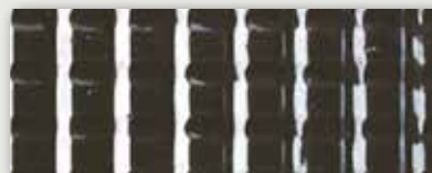
Gris - Dark grey