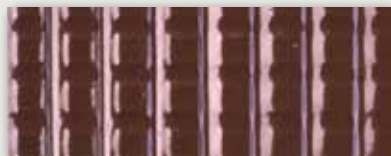
Rouge - Dark red

Ce nuancier ne constitue pas un document contractuel. Il convient de consulter les documents de référence en vigueur. La société icopal se réserve le droit de modifier ses modèles et ses coloris, sans préavis. La société Siplast-Icopal renseignera, à tout moment, les utilisateurs sur la disponibilité de produits dans les couleurs indiquées dans ce nuancier.