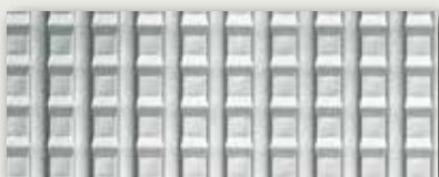
Aluminium naturel Natural aluminium