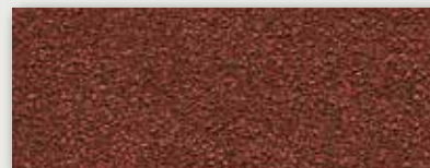
52 Rouge bauxite - Bauxite red