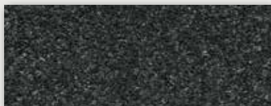
30 Gris ardoise (foncé) - Dark grey