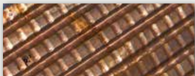
Cuivre - Copper