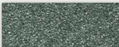
1 Gris clair - Light grey