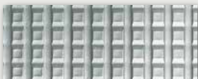
Acier inoxydable - Stainless steel