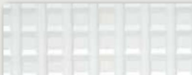
Blanc - White